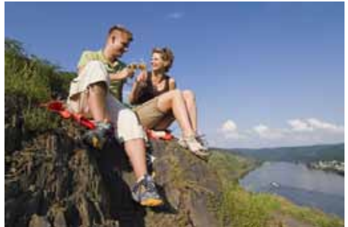
Weinverkostung in den Weinbergen