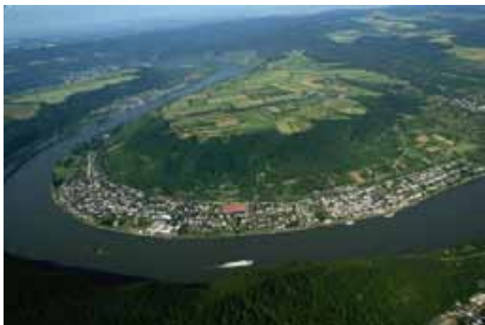
Blick auf Spay