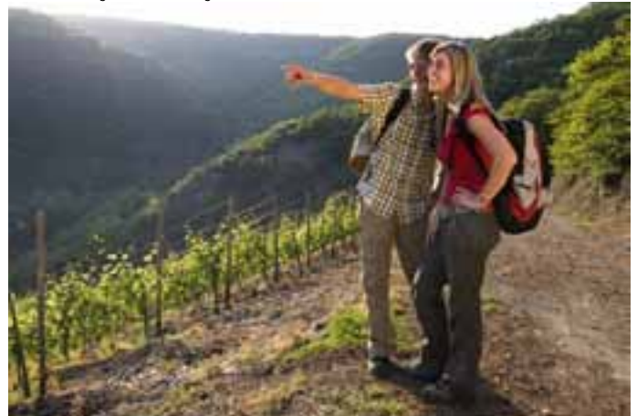
Im Bopparder Hamm