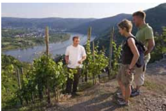
Winzer am Bopprader Hamm bei der Arbeit